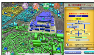
●「地域危険度マップ」コンテンツ画面

「地域危険度マップ」「浸水ハザードマップ」の2種類のコンテンツを選んで表示させることができます。住所検索機能を備え地震や浸水危険度を色分け表示するほか、過去の浸水被害の写真も表示します。タッチパネルになっているので子供からお年寄りまで幅広い年齢の方々に画面に軽く触れるだけで簡単に親しみながら防災情報を得ていただくことができ好評を得ています。