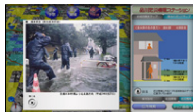
●「浸水ハザードマップ」コンテンツ画面